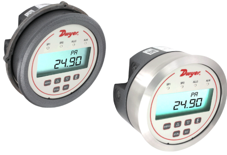
注：可选不锈钢边框

与 Photohelic® 尺寸一样的数显微差压控制器，开方输出用于风速 / 风量